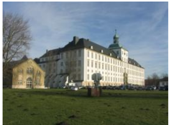
Schleswig, Schloß Gottorf

Voraussichtlich im Juni 2018 erhältlich!