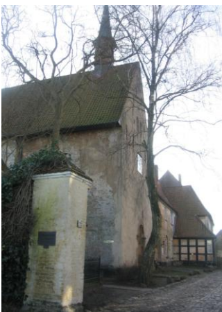
Das Johanniskloster in Schleswig