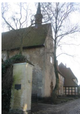
Das Johanniskloster in Schleswig