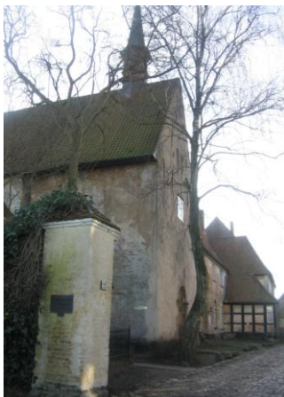
Das Johanniskloster in Schleswig

1. In vier Tagesetappen wandert der Pilger zunächst von der dänisch/deutschen Grenze hin zur ältesten Stadt im Ostseeraum: Schleswig. Hier teilt sich der Weg. Während der eine Teil weiter südwärts nach Glückstadt führt, liegt am Ende des anderen die Hansestadt Lübeck, der größte mittelalterliche Sammelort der Pilger aus dem Ostseeraum.